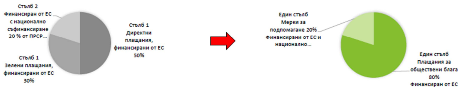
Фигура 2: Излизане от статуквото и преминаване към плащания за земеделие от ЕС въз основа на доставени обществени блага

*например: консултации и съветнически услуги за фермери, верига за доставки, иновации, плащания за биологично производство и промоционални дейности